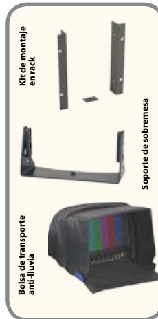
Kit de montaje en rack