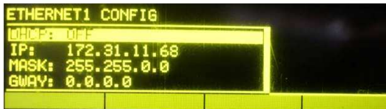
Pantalla configuración puerto Ethernet 1