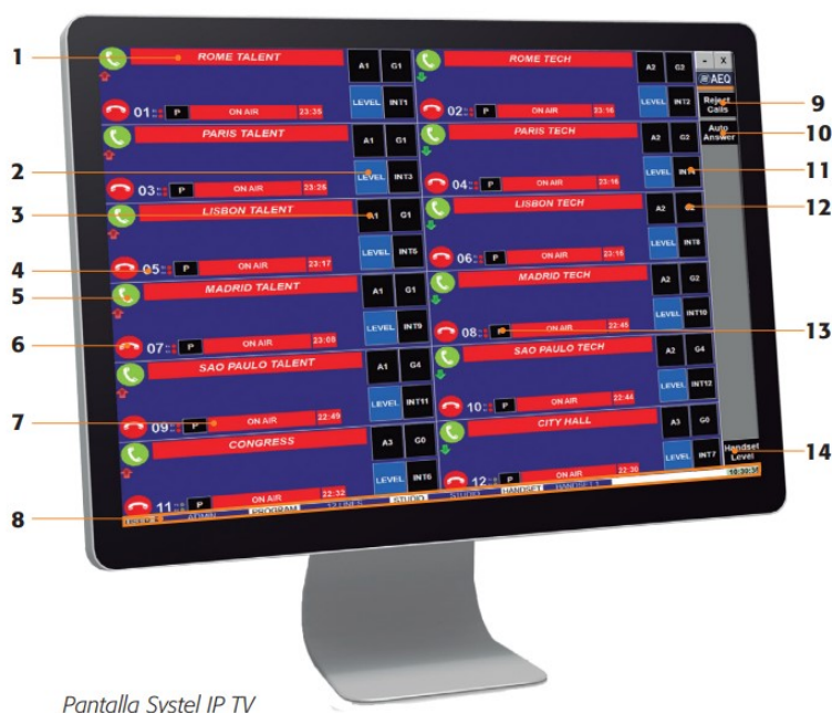
Pantalla Systel IP TV